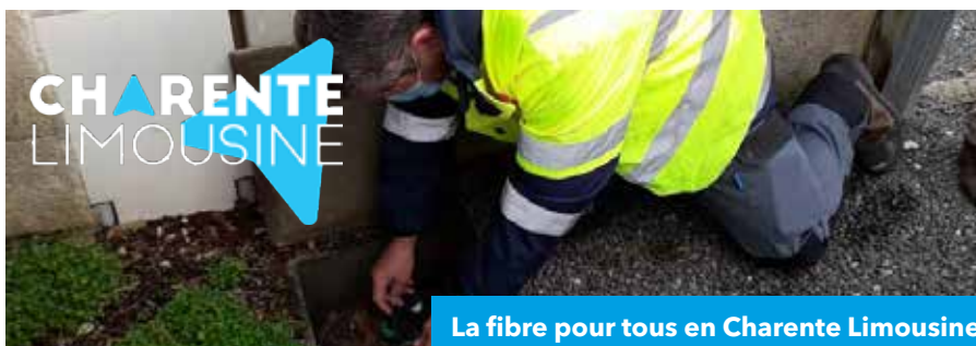
La fibre pour tous en Charente Limousine

Les élus ont choisi de se doter d'outils complémentaires en matière de préservation de la biodiversité et du commerce via des Orientations d'Aménagement et de Programmation qui fixent des grands principes complémentaires au règlement.