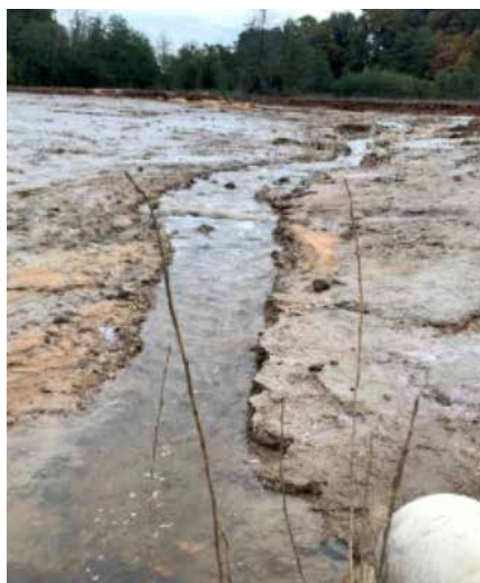
Etang vide avec le ruisseau du Chambon...