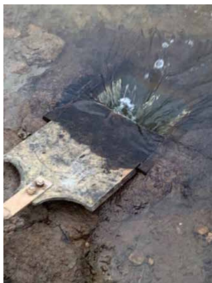
Pelle de fond